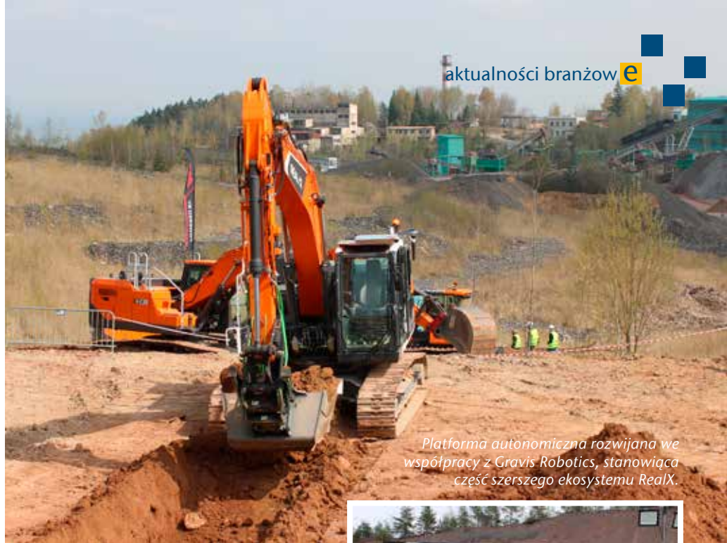
Platforma autonomiczna rozwijana we współpracy z Gravis Robotics, stanowiąca część szerszego ekosystemu RealX.

Elektryfikacja obejmuje zarówno maszyny ciężkie, jak i kompaktowe. Koparka EX250LCE została wyposażona w baterię o pojemności 570 kWh i zachowuje parametry robocze porównywalne z wersją dieslowską. Czas pracy wynosi od 8 do 10 h, natomiast szybkie ładowanie pozwala na uzupełnienie energii w ok. 2,5 h. W warunkach niskich temperatur stosowane są systemy podgrzewania baterii, które zapewniają ich optymalną pracę.