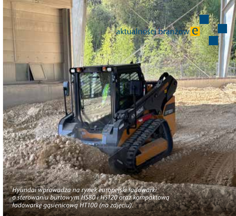
Hyundai wprowadza na rynek europejski ładowarki o sterowaniu burtowym HS80 i HS120 oraz kompaktową ładowarkę gąsienicową HT100 (na zdjęciu).

Centralnym punktem prezentacji były koparki nowej generacji, które Hyundai traktuje jako fundament dalszego rozwoju. Model HX300 reprezentujący klasę 30 t został wyposażony w silnik DX08 o mocy 207 kW i momencie obrotowym 1230 Nm. W porównaniu do poprzedniej generacji oznacza to wzrost mocy o 9%, przy jednoczesnym ograniczeniu zużycia paliwa o 7% i AdBlue o 30%. Interwały serwisowe wydłużono do 1000 h. Zastosowany w tej