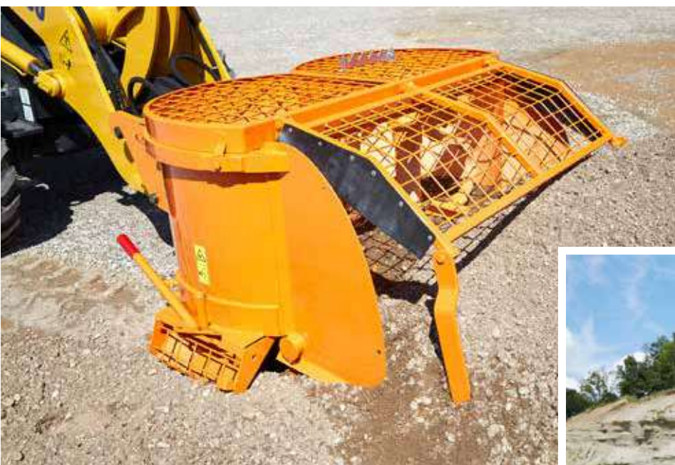
Mieszalniki z serii Duplex DFA (od lewej) i Duplex DK (od prawej) podczas pracy w terenie.

Opróżnianie mieszanki możliwe jest na dwa sposoby: poprzez boczne zsypy lub bezpośrednio do przodu.