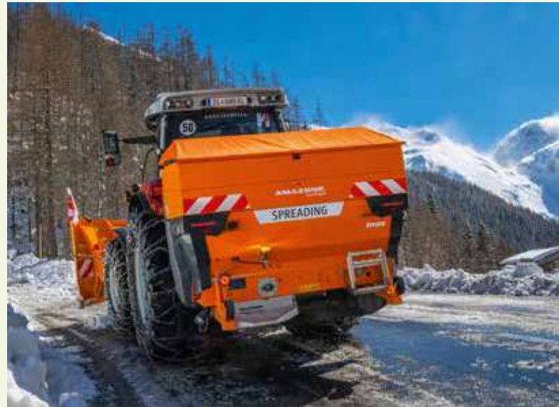
W segmencie zimowego utrzymania dróg Amazone wprowadza rozsiewacze IceTiger Inox oraz IceTiger S Inox, które charakteryzują się konstrukcją zbiornika wykonaną w całości ze stali nierdzewnej.

Podkreślić należy, iż kosiarka może być wyposażona w dwa różne systemy tnące: sierpowy mechanizm BladeCut o szerokości roboczej 1,8 m zapewnia wysoką wydajność powierzchniową. Konstrukcja opiera się na wytrzymałych komponentach, takich jak odporne na zużycie łożyska i tarcze tnące, a dodatkowe zabezpieczenia chronią przed uszkodzeniami mechanicznymi. System działa na zasadzie szybkiego obrotu ostrzy, co umożliwia równomierne rozprowadzanie ścinoków i ogranicze-