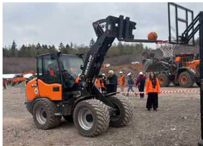
Develon Demo Days, czyli od... Van Gogha do Michaela Jordana.