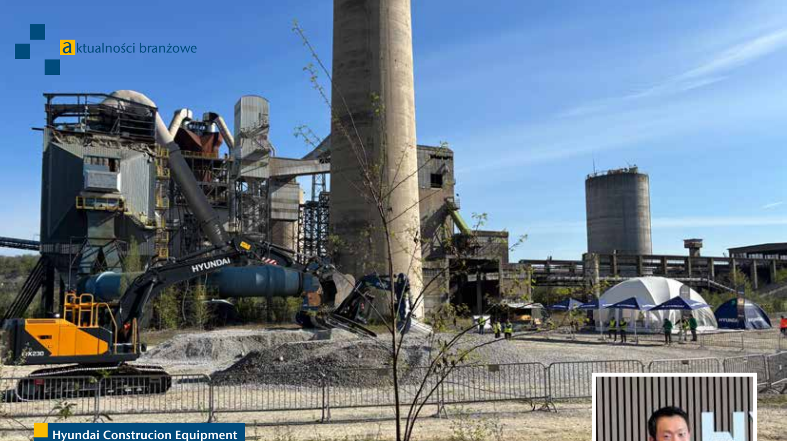
Hyundai Construction Equipment