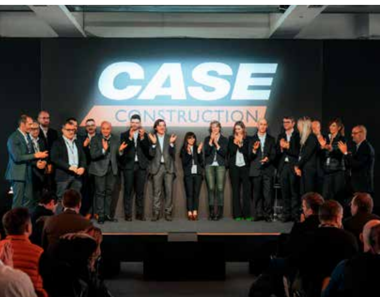
Spotkanie miało na celu ujednoczenie strategii oraz wymianę doświadczeń, podkreślając znaczenie silnych relacji partnerskich w dalszym rozwoju marki.

Europejski zjazd dilerów Case Construction Equipment, który odbył się w Lecce, stał się platformą do omówienia kluczowych kierunków rozwoju firmy oraz roli sieci dilerskiej w dynamicznie zmieniającym się rynku maszyn budowlanych.