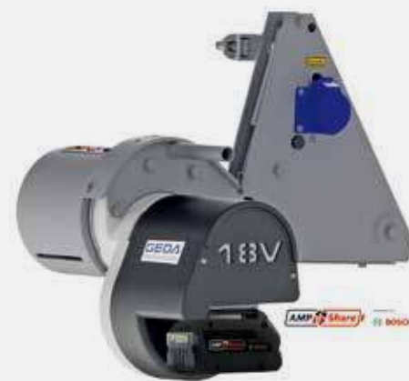
Nowa wciągarka Geda Maxi 18V.

Istotnym elementem konstrukcji jest redukcja masy urządzenia o około 25% w porównaniu do standardowych modeli tej klasy. Lżejsza budowa przekłada się bezpośrednio na łatwiejszy transport oraz montaż w trudniej dostępnych miejscach. Producent zwraca uwagę również na uproszczony proces insta-